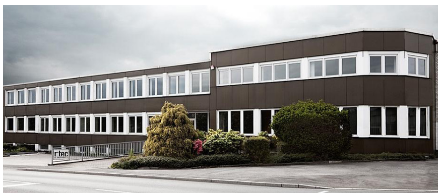
Die r-tec IT Security GmbH wurde 1996 als Unternehmen der Böhme & Weihs Gruppe gegründet.

r-tec IT Security ist eine operative Einheit unter dem Dach der Böhme und Weihs-Holding. Unsere derzeit 60 Mitarbeiter in den beiden Abteilungen Vertrieb und Technik arbeiten für mittelständische Unternehmen, aber auch für Großkunden wie Banken oder das Logistikunternehmen TNT.