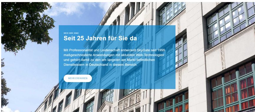
SkyGate steht für langjährige Erfahrung in der Anwendungsentwicklung.

Projektron BCS erfüllte alle unsere Erwartungen. Wir beziehen unsere Kunden mit einem Kun-