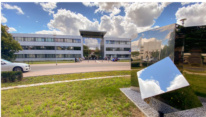
Das Carl-Thiem-Klinikum umfasst eine Vielzahl an Kliniken, Departments und Sektionen, Insitute und weiterer Einrichtungen.

Zentrale Aufgabe der Abteilung Digitalisierung & Innovation des Carl-Thiem-Klinikums ist die erfolgreiche Umsetzung der strategischen Digitalisierungsprojekte des CTK.