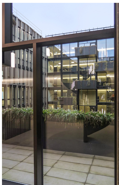
Die Gebäude des Information Service Center (ISCeco) in Bern.