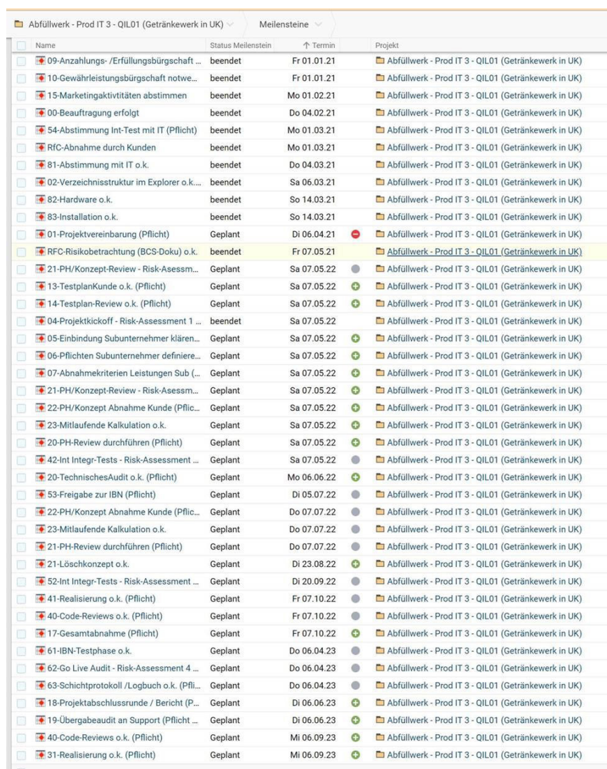
Projektplanung mit Projektron BCS.

Diese Verflechtung von Qualitätsmanagement und Projektabwicklung stellt sicher, dass die Erfahrung aus vorangegangenen Projekten auch