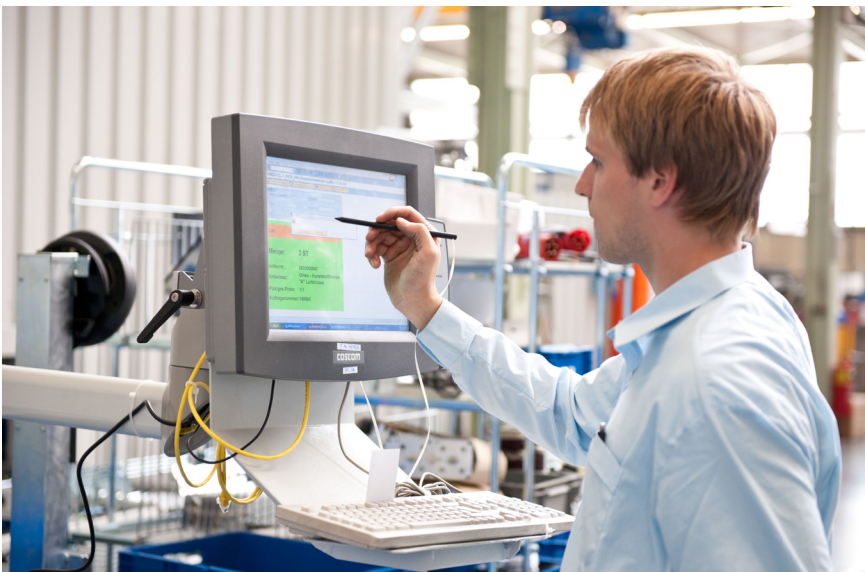
Implementierung bei der Firma Cloos Schweißtechnik

In solchen Projekten ist die Abstimmung von Qualitäts- und Projektmanagement aufeinander entscheidend. Nur so können wir unsere Lösungen bei laufendem Betrieb und unter hohem Zeitdruck einführen. Für diesen reibungslosen