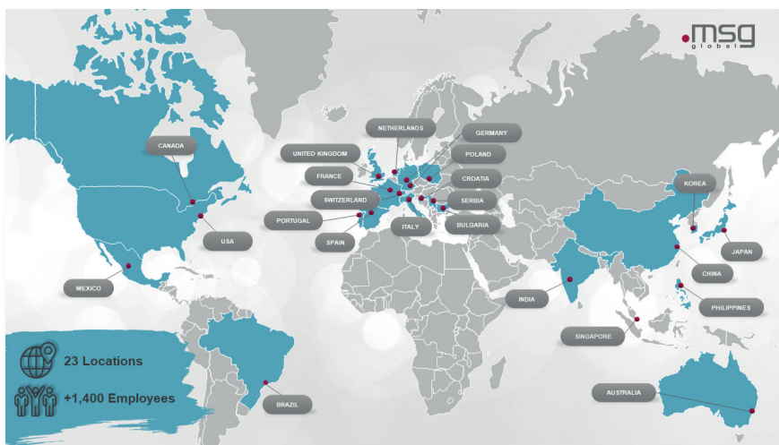
Die msg global setzt Projektron BCS zentral für über 23 eigene Länderorganisationen ein. (Grafik: msg global)