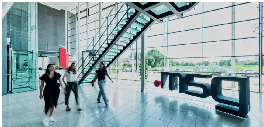
msg global beschäftigt heute über 1.400 Mitarbeiter in 23 Niederlassungen auf der ganzen Welt.

Unsere Projekte sind unterschiedlich stark strukturiert. Wir haben eine klassische Projektstruktur mit Unterprojekten, Tasks und Aufwänden, aus denen wir den Ressourcenbedarf und die Ressourcenzuordnung managen. BCS bildet unsere komplette Plan- und Ist-Sicht für die Projekte ab. Das typische Einsatzszenario für BCS bei msg global ist die gesamte Teamverwaltung, Aufwands- und Ressourcenplanung als auch Buchungen