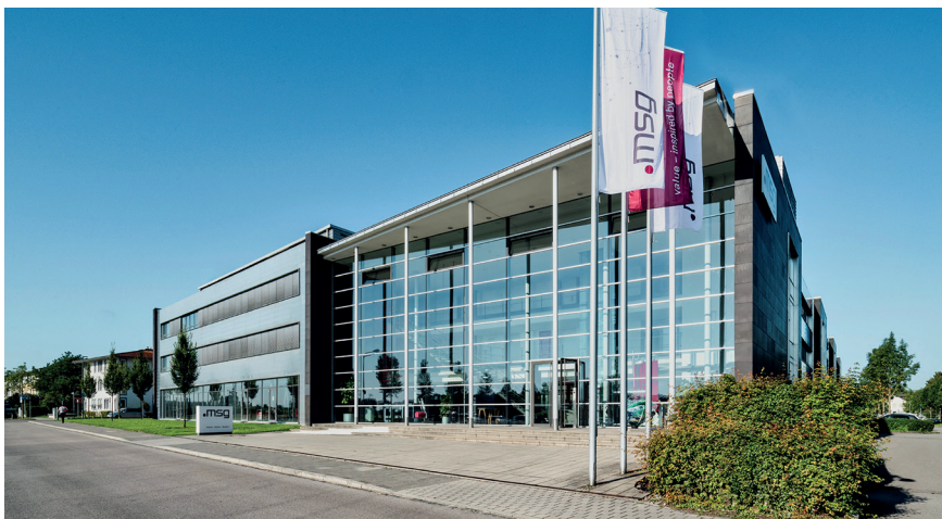
Die msg global wurde 2008 in Ismaning bei München als Entwicklungspartner und internationale Einheit der msg-Gruppe für das SAP-Geschäft gegründet.

cherer und Banken zu ihren Kunden, bietet aber auch Beratungsleistungen für andere große Kunden aus verschiedenen Branchen wie Industrie und Dienstleistungen an.