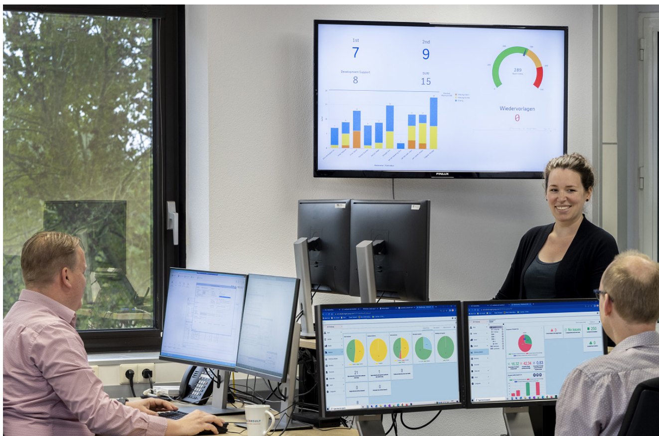
Die Mitarbeiter und Mitarbeiterinnen verschaffen sich einen Überblick über die Projekte mit dem BCS Data Dashboard.

Weitere Anwenderberichte und mehr Informationen zu Projektron BCS finden Sie unter www.projektron.de