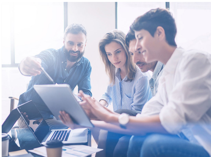
Digitalisierung in der Aus- und Weiterbildung

Kompetenzen in den Bereichen IT-Management, Change Management und Projektmanagement entwickeln wir individuelle und bedarfsgerechte E-Learning-Lösungen für unsere Kunden. Wir verstehen uns als Zentrum für den Kompetenzaufbau, den Wissenstransfer und die Koordination des Einsatzes digitaler Medien in der Bildung.